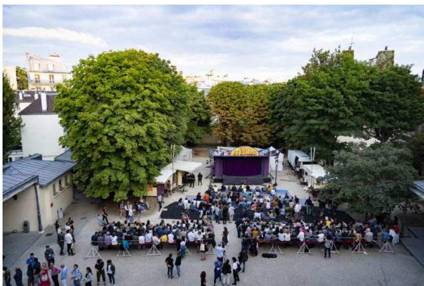
Paris L'Été Centre Culturel Irlandais