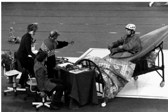
1 er Championnat de France de N'Importe Quoi (2003)

Un pied dehors, un pied dedans, un jour en rue, un jour en salle, les 26000 tracent depuis une vingtaine d'années un itinéraire artistique singulier entre pulsions satiriques débridées, burlesque dévastateur et poésie brute.