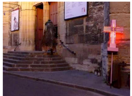
Beaucoup de bruit pour rien de Shakespeare (2006)