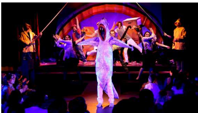
L'Idéal Club (2010)

C'est cet esprit burlesque, décalé et poétique, et ce plaisir de la rencontre avec le public, qu'on retrouve dans leurs créations.