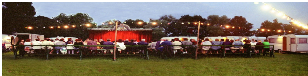
Tournées Fournel (2000)

Un pied dehors, un pied dedans, un jour en rue, un jour en salle, les 26000 tracent depuis une trentaine d'années un itinéraire artistique singulier entre pulsions satiriques débridées, burlesque dévastateur et poésie brute.