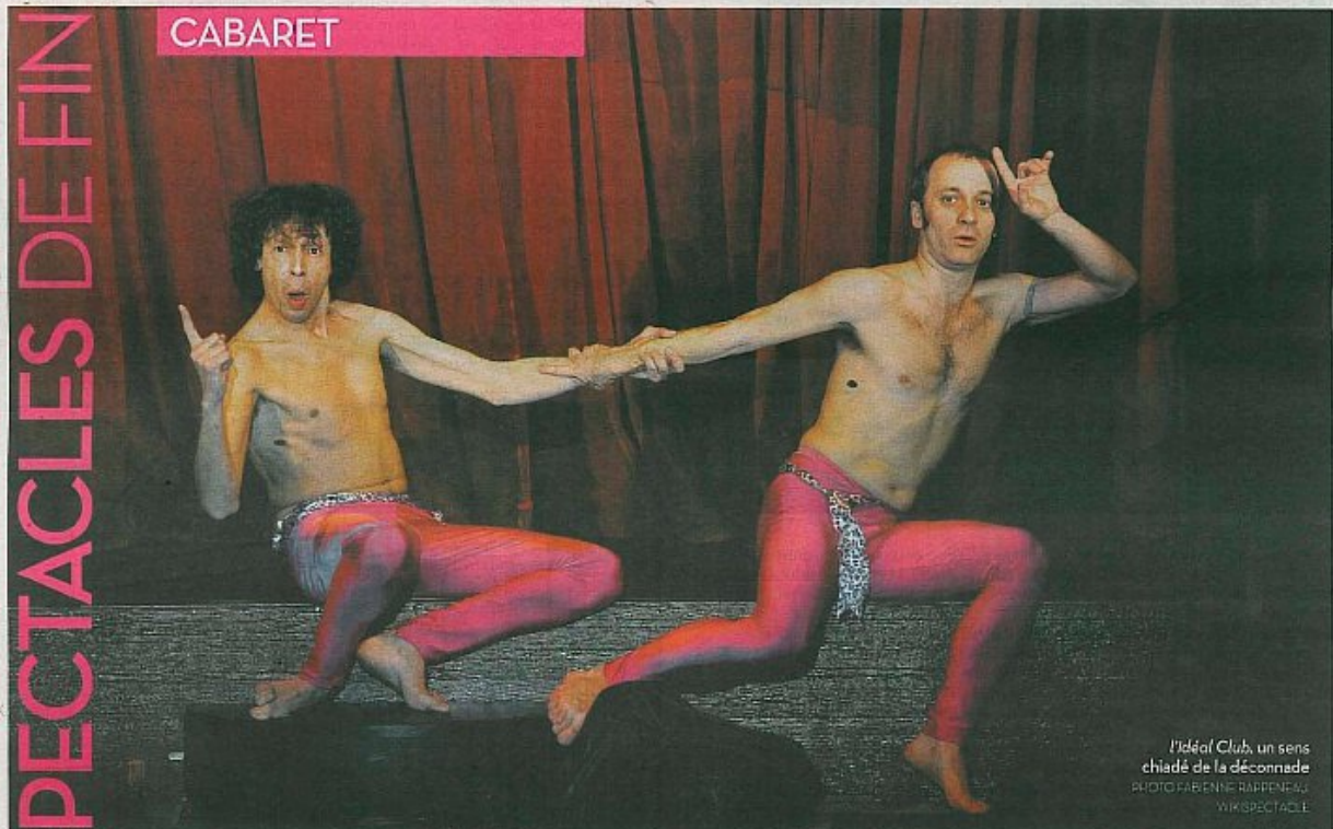
L'Idéal Club, un sens chiadé de la déconnade

26 000 COUVERTS L'IDÉAL CLUB Théâtre Monfort, 104, rue Brancion (75014) jusqu'au 9 janvier (mar-ven à 20h30, dim à 17 heures) Rens. : 0156 06 33 86