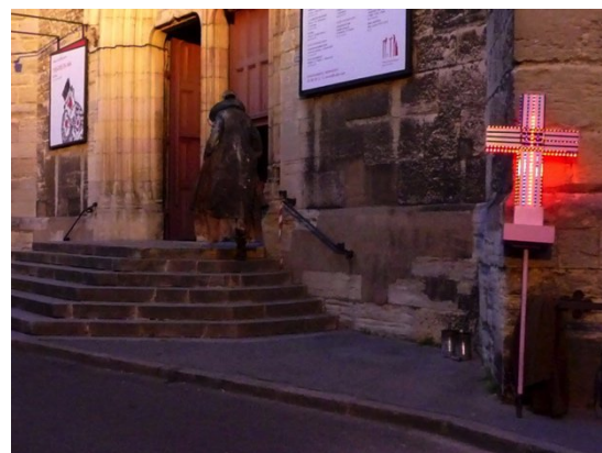
Beaucoup de bruit pour rien de Shakespeare (2006)

ARTCENJ: dossier sur la compagnie par Valérie de Saint Do, septembre 2023. Clic !