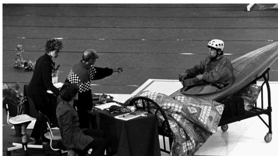
1 er Championnat de France de N'Importe Quoi (2003)

Un pied dehors, un pied dedans, un jour en rue, un jour en salle, les 26000 tracent depuis une trentaine d'années un itinéraire artistique singulier entre pulsions satiriques débridées, burlesque dévastateur et poésie brute.