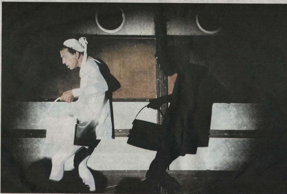
L'Idéal Club, de la compagnie bourguignonne les 26 000 Couverts.

FESTIVAL En Saône-et-Loire, les 26 000 Couverts présentent «l'Idéal Club», création burlesque et inventive en quête du show parfait.